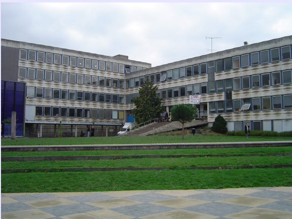
Un écosystème complexe et riche

Le pétard est ton ami, ta force et ta seule activité de la journée. Le babos est plus qu'écolo, il transcende la nature et roule souvent en vieille voiture rustique et polluante. Le poncho fièrement fixé sur un torse creux le babos se déplace avec assurance le long des pelouses du campus en rêvant d'un monde meilleur, plus calme, et emporte des livres épais de la BU qu'il feuillettera d'un oeil distrait et rougi en écoutant du reggae dans son petit apart fleurant bon les fruits glanés en fin de marché. La vie est belle pour lui, l'hygiène n'est plus une menace. Allez, fait tourner.